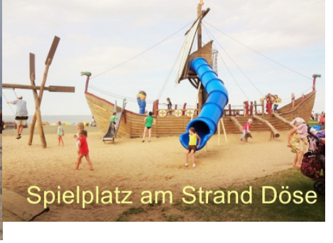
Spielplatz am Strand Döse