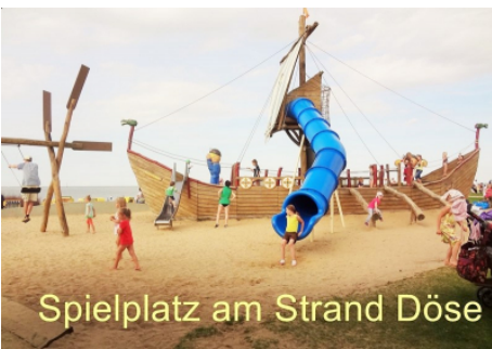
Spielplatz am Strand Döse