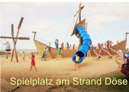
Spielplatz am Strand Döse